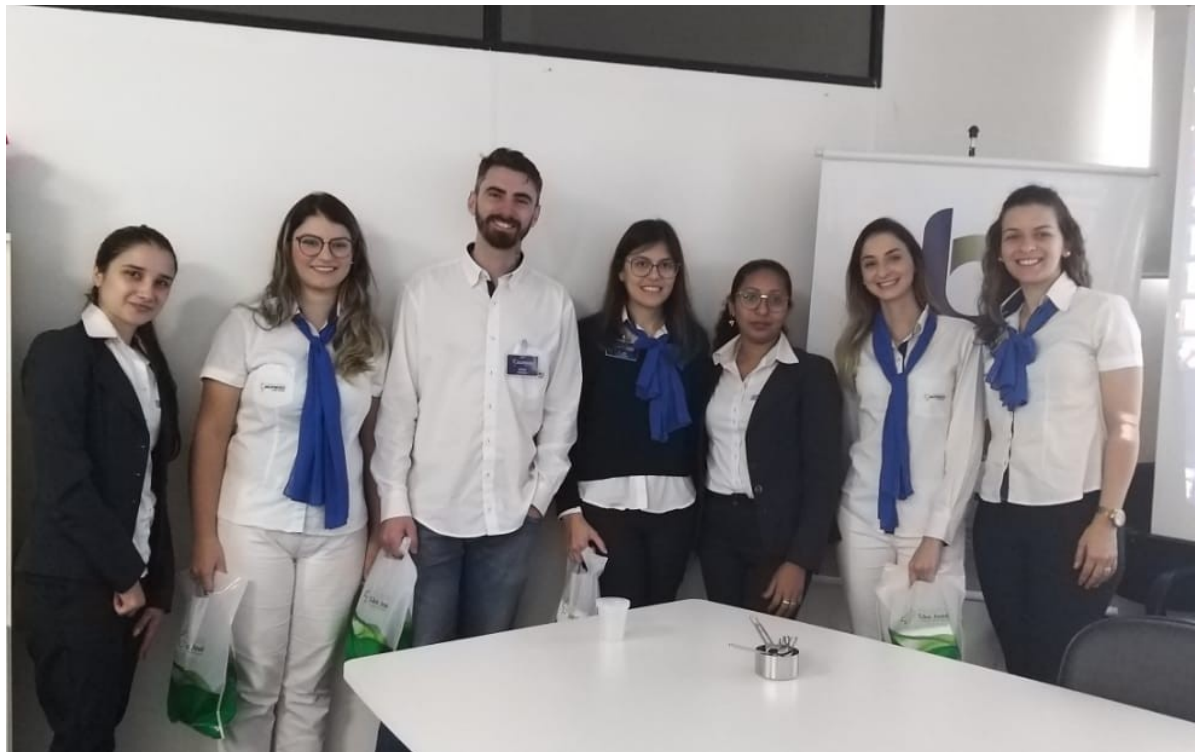
Figura 5 – Foto do Encontro