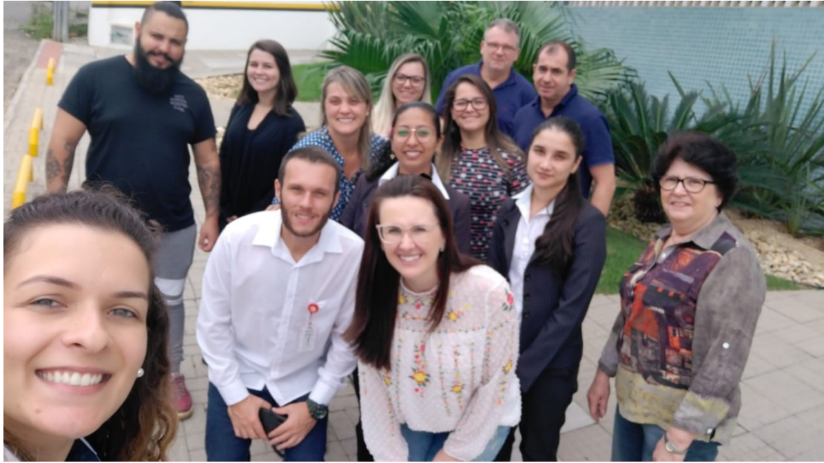
Foto do encontro