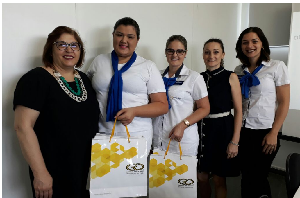
Figura 4 – Foto do Encontro