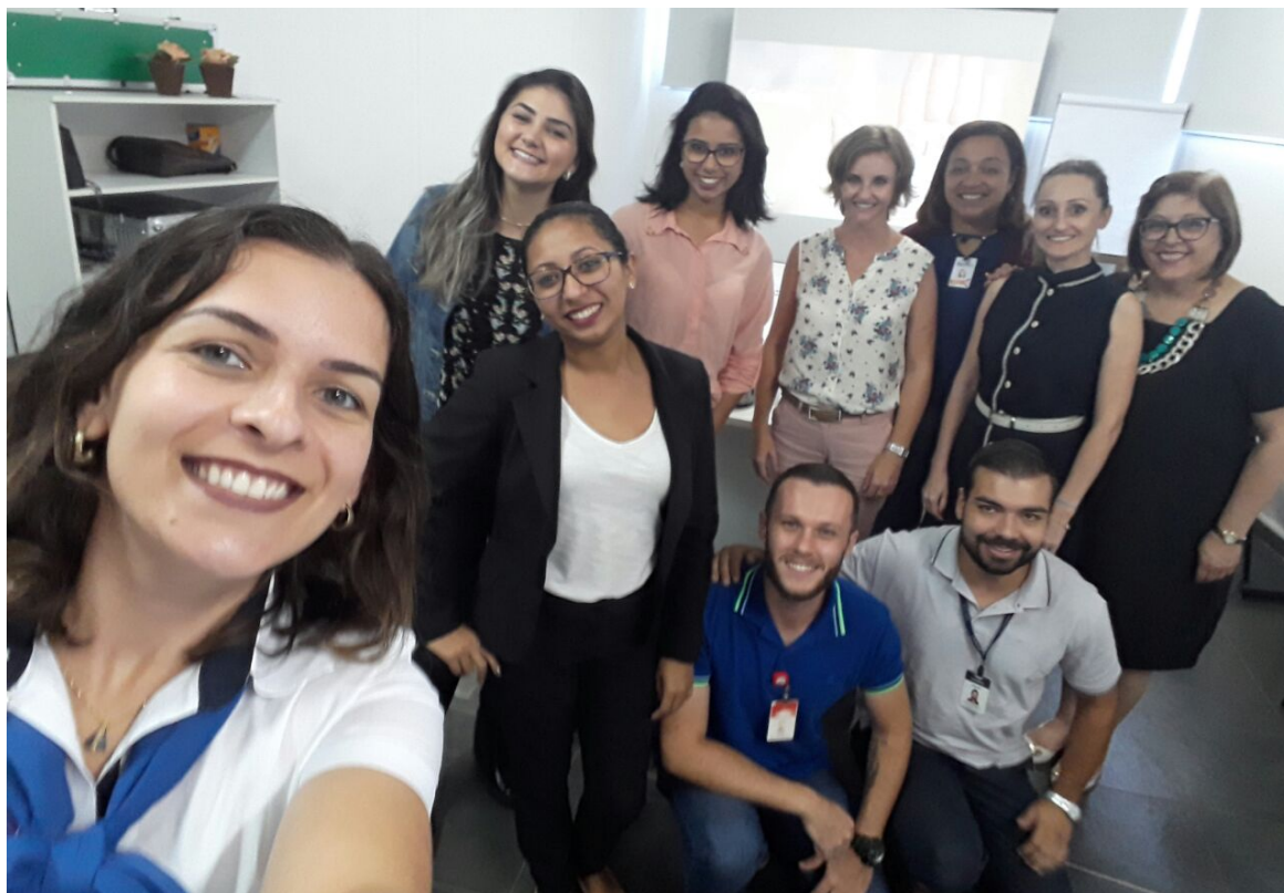
Foto do encontro